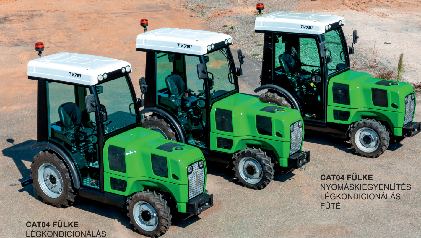
CAT04 FÜLKE LÉGKONDITIONÁLÁS FŰTÉ